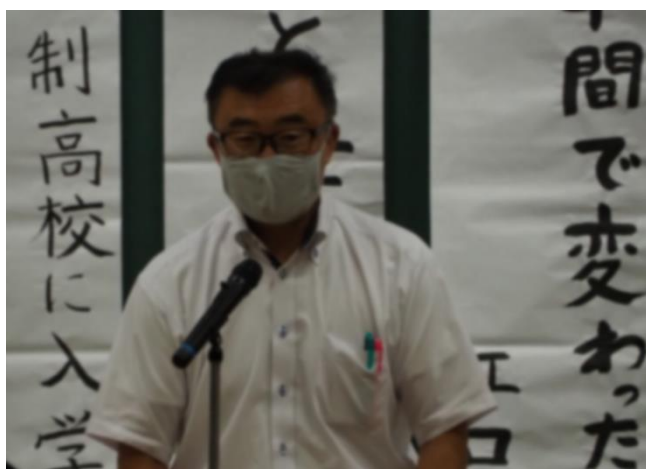
▲ 校長先生から、講評をいただきました。