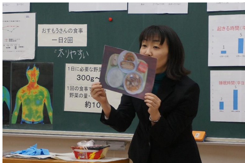
▲ 1年生の食育教室です