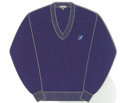
ニットセーター ※男女共用