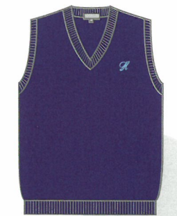
ニットベスト ※男女共用